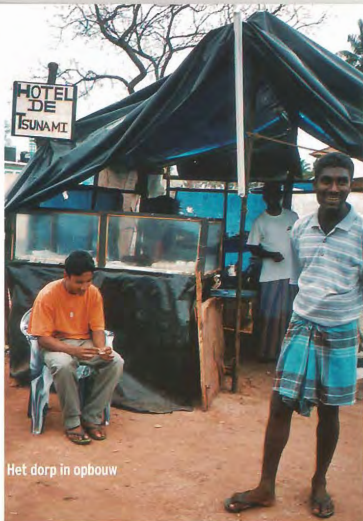
Het dorp in opbouw